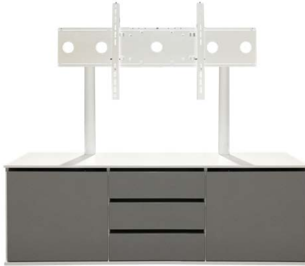
Abbildung: Media Side select dreifach, Türen links und rechts, mittig optionales Schrankmodul aus je drei Schubladen, mit Stellfüßen